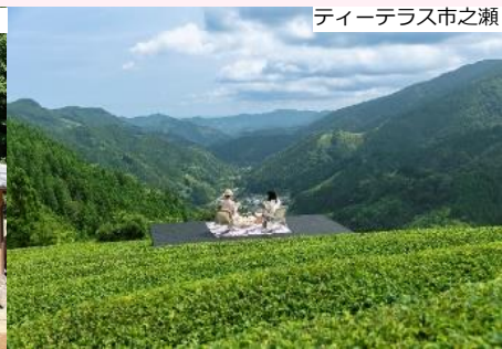
ティーテラス市之瀬