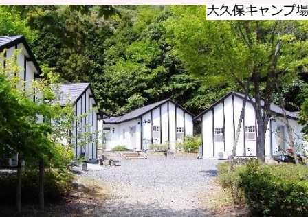
大久保キャンプ場